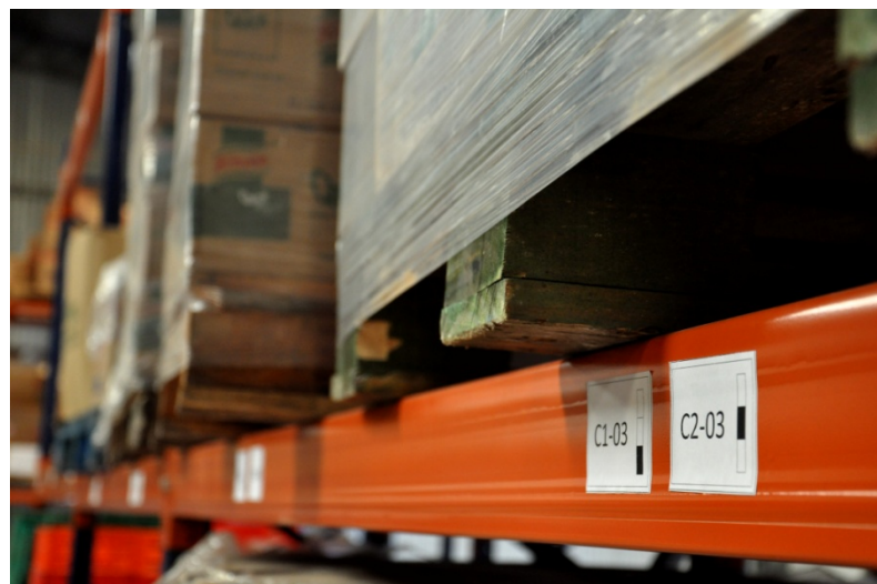
Imagen 5 - Identificación de Posiciones en Racks