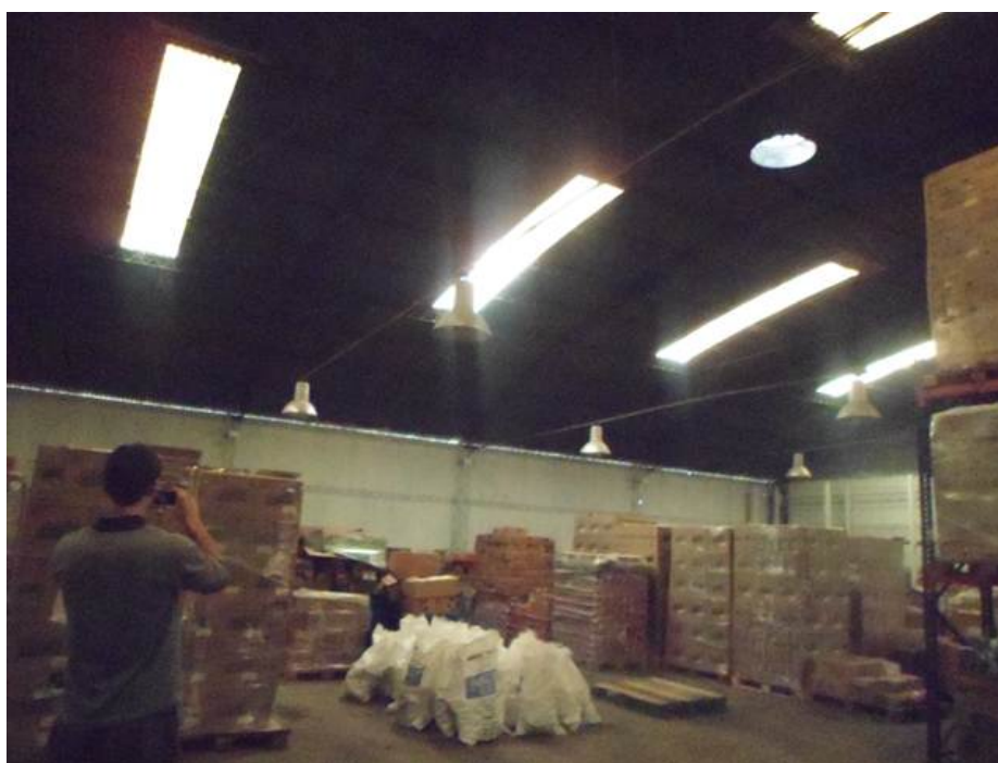
Imagen 2 – Situación Inicial del Almacén