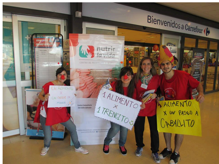
Imagen 11 - Becarios en Colecta de Alimentos