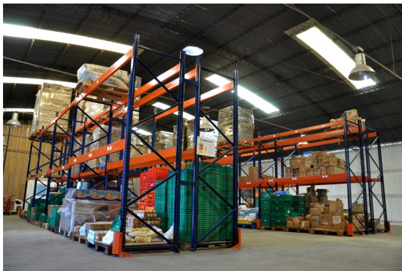
Imagen 4 – Nuevos Racks Selectivos Comprados