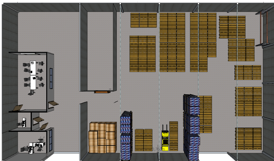
Imagen 1 - Lay Out Inicial

A continuación, se muestran algunas imágenes que ilustran las actividades realizadas: