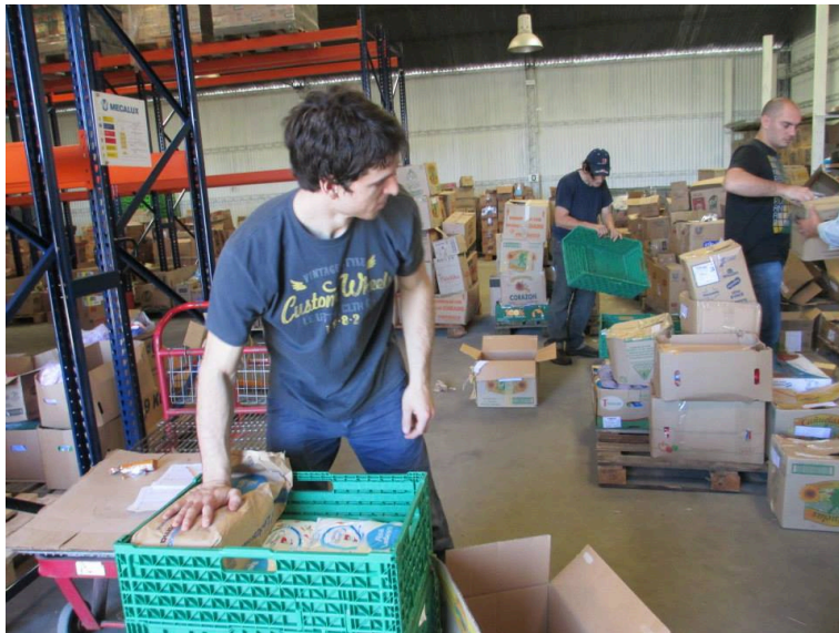
Imagen 9 - Becarios Trabajando en Clasificación