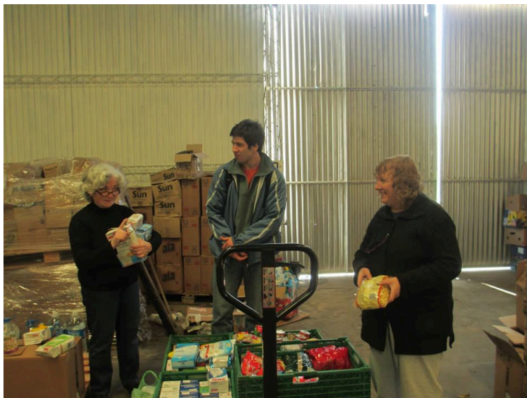
Imagen 10 - Becarios junto a Voluntarios BALP