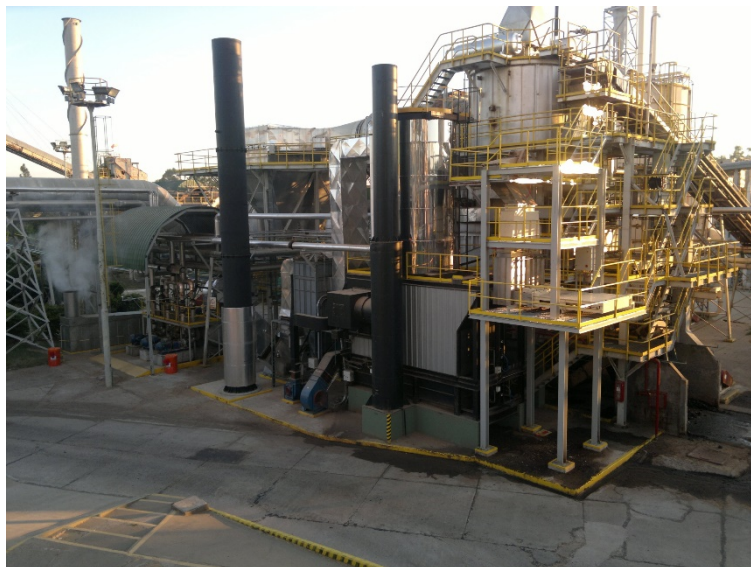
Figura 4 Ubicación de la caldera en MDF2

Con el nuevo equipo se logran los ahorros de combustible estimados y una mejora en los indicadores de ecoeficiencia, que se detallan a continuación: (i) un ahorro de 1.200.000 m 3 /año de gas natural en operaciones normales y un ahorro de 40.000 litros de gas oíl/año en operaciones en fechas de restricción en el consumo de gas natural; (ii) disminución del 9% en el indicador de Energía Fósil más Eléctrica; (iii) disminución del 25% en el indicador de emisiones de CO 2 ; (iv) disminución del 50% en los residuos a disposición final que se utilizarían como biomasa combustible.