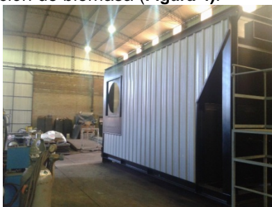
Figura 3 Caldera Gonella

Con base en la premisa anterior se evalúan propuestas y se adquiere un equipo de la empresa nacional Gonella. Dicho equipo es un hogar de piso móvil ( Figura 3 ), de grilla escalonada que permite la alimentación de residuos, chips y corteza en su extremo superior, permitiendo su quema controlada. La ubicación del nuevo equipo se realiza en paralelo al de la de la planta de energía uno para aprovechar la alimentación de biomasa ( Figura 4 ).