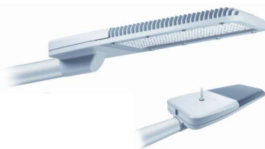
Figura 5 PHILIPS – Greenvision 140 W

Ante la necesidad de contar con soluciones sustentables se ha trabajado en el desarrollo de luminarias con tecnología led para iluminación vial. PHILIPS - Greenvision (XCEED-BRP372 M1 64LED – 140W) incorpora una nueva generación de plataforma led para alto rendimiento lumínico en Lm/W y con un significativo ahorro energético de más del 50% con relación a lámparas de descarga de sodio, aptas para iluminación en autopistas, rutas, avenidas, calles, espacios urbanos playones de maniobras, etc. (Figura 5)